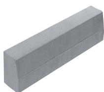
doppio strato grigio