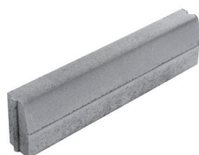
doppio strato grigio