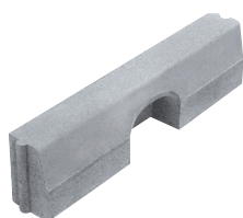
doppio strato grigio